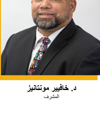
د. خافيير مونتائيز المشرف

تقدم لك ترحابنا في أحدث إصدار من النشرة الإخبارية نصف الأسبوعية لمقاطعة مدرسة بروفيدينس العامة (PPSD)! إذا فاتتك أنت أو أي شخص تعرفه إحدى نشراتنا الإخبارية، فيمكنك إيجادها في الإصدارات السابقة على موقع المقاطعة بلغات متعددة.