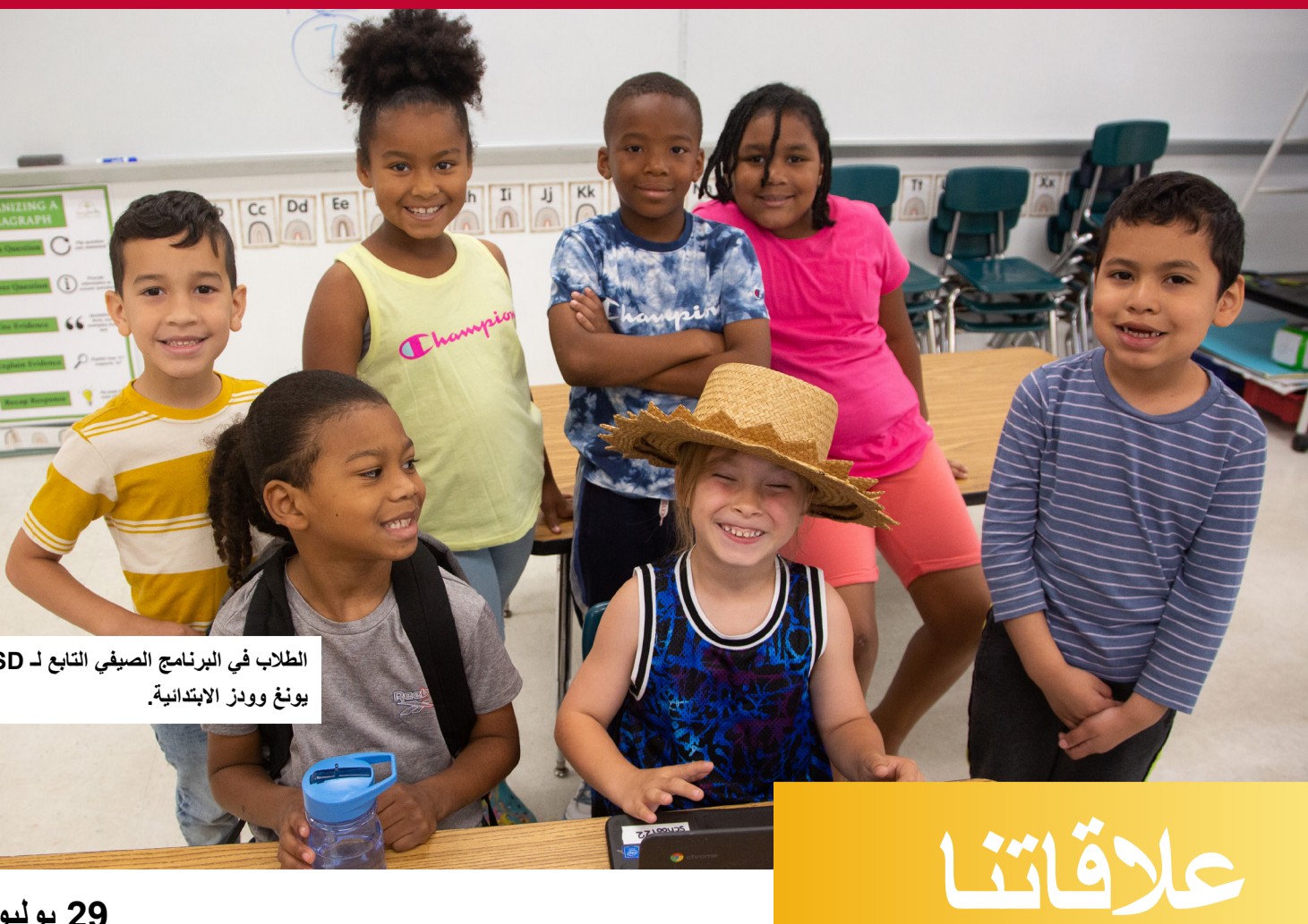
الطلاب في البرنامج الصيفي التابع لـ PPSD في مدرسة يونغ وودز الابتدائية.